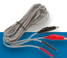
Cable de 6', clip y blindado