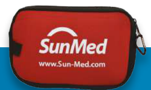
Bolso de neopreno con cierre