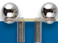
Electrodo de bola y hueco