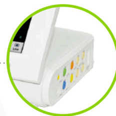
Sonda de identificación automática