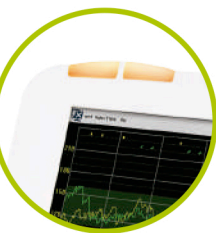
Sistema de Alarma

El monitor fetal C21 se puede utilizar para controlar parámetros fetales: frecuencia cardíaca fetal, las condiciones maternas, el movimiento fetal.