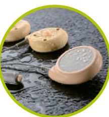
Sonda aprueba de agua